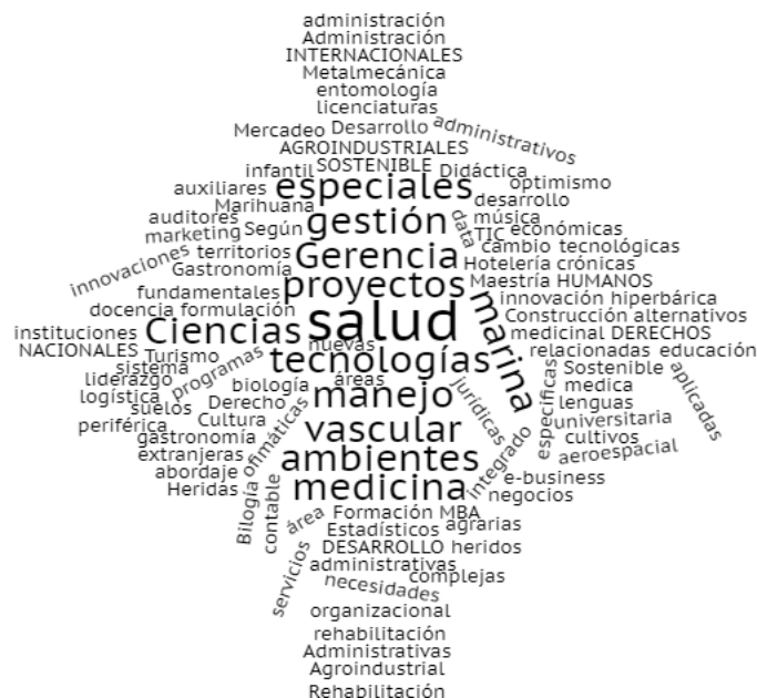
Figura 3. Nube de palabras servicios requeridos en Especialización, maestría o equivalente

En la figura 3 se puede observar una nube de palabras que resume los intereses de los encuestados en Especialización, maestría o equivalente.