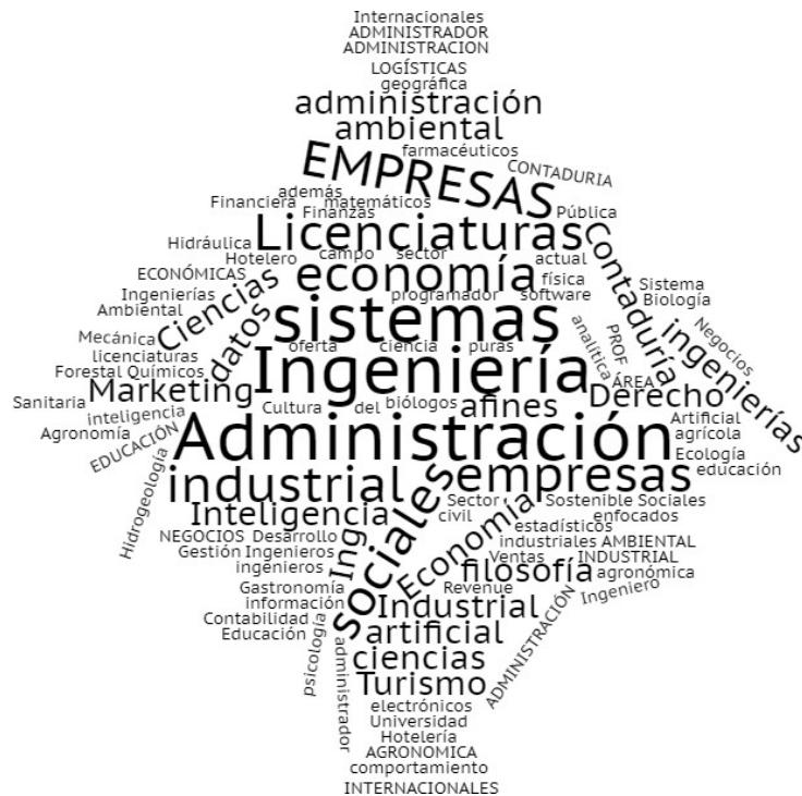
Figura 2. Nube de palabras servicios requeridos en universitario (Profesional) o equivalente

De igual manera, en la tabla 6, se especifica cada una de las necesidades enunciadas por los encuestados.