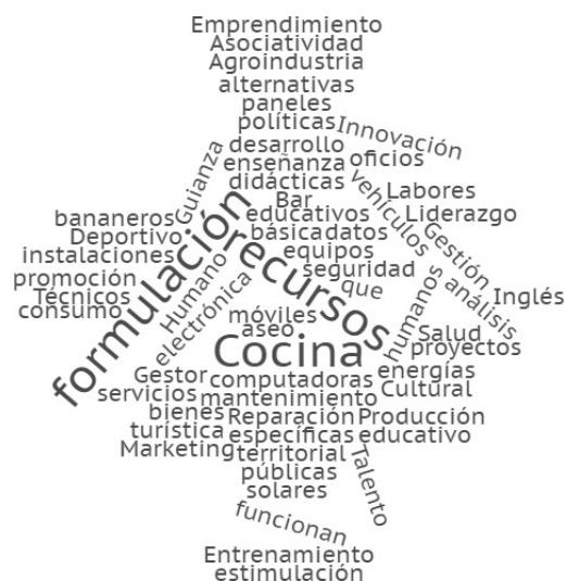
Figura 4. Nube de palabras servicios requeridos en Educación para el Trabajo y Desarrollo Humano

En la tabla 8 se evidencia cada una de las necesidades requeridas por los encuestados.