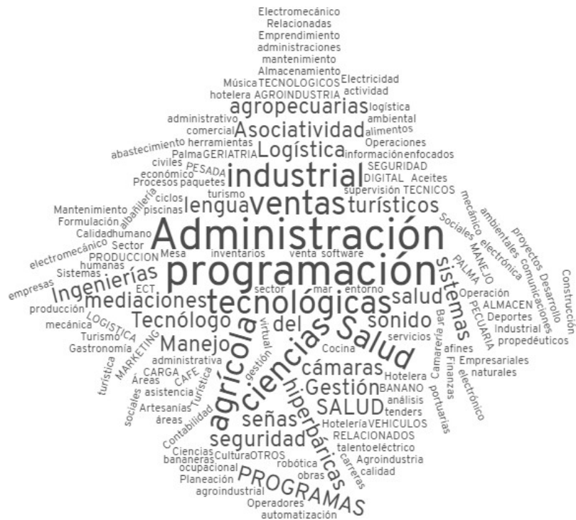
Figura 1. Nube de palabras servicios requeridos en Educación técnica, profesional y tecnológica

En la figura 1, se puede observar una nube de palabras que resume los intereses de los encuestados en educación técnica, profesional y tecnológica.